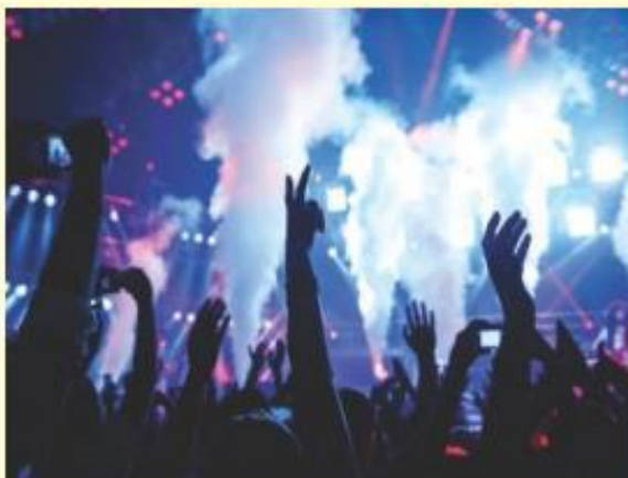
Espetus Casa de Shows